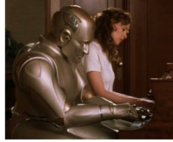
1999 L'HOMME BICENTENAIRE (Bicentennial Man) de Chris Columbus