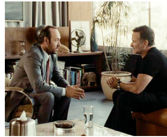
2008 LE PSY D'HOLLYWOOD (Shrink) de Jonas Pate avec Kevin Spacey