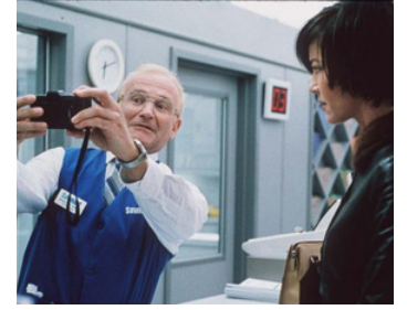
2002 PHOTO OBSESSION (One Hour Photo) de Mark Romanek