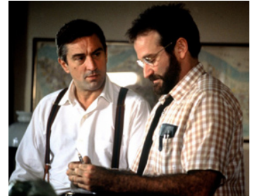
1990 L'ÉVEIL (Awakenings) de Penny Marshall avec Robert De Niro