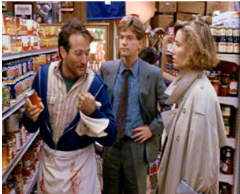
1991 DEAD AGAIN (Dead Again) de Kenneth Branagh avec K. Branagh, Emma Thompson