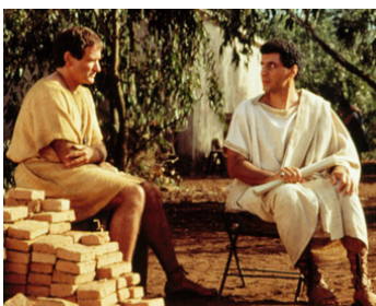
1993 LES 1001 VIES D'HECTOR (Being Human) de Bill Forsyth avec John Turturro