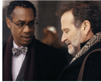
2006 UNE VOIX DANS LA NUIT (The Night Listener) de Patrick Stettner avec Joe Morton