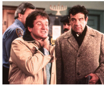
1983 LES RESCAPÉS (The Survivors) de Michael Ritchie avec Walter Matthau