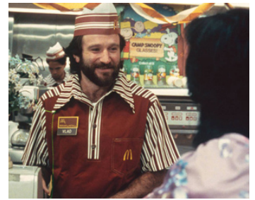
1984 MOSCOU À NEW YORK (Moscow on the Hudson) de Paul Mazursky