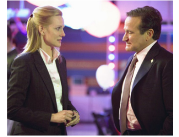
2006 MAN OF THE YEAR (Man of the Year) de Barry Levinson avec Laura Linney