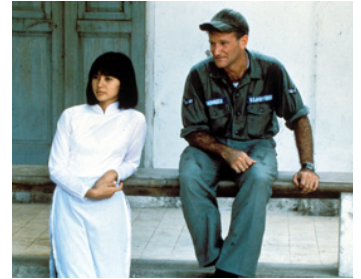
1987 GOOD MORNING, VIETNAM (Good Morning, Vietnam) de B. Levinson avec Chintara Sukapatana