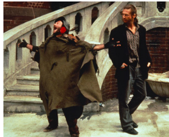
1991 THE FISHER KING (The Fisher King) de Terry Gilliam avec Jeff Bridges