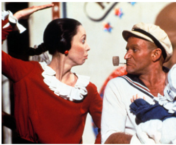
1980 POPEYE (Popeye) de Robert Altman avec Shelley Duvall