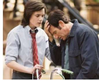
2004 LE PRINCE DE GREENWICH VILLAGE (House of D) de David Duchovny avec Anton Yelchin