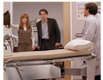
1995 NEUF MOIS AUSSI (Nine Month) de Chris Columbus avec Julianne Moore, Hugh Grant