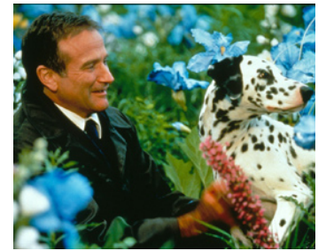
1998 AU-DELÀ DE NOS RÊVES (What Dreams may come) de Vincent Ward