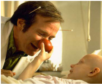
1998 DOCTEUR PATCH (Patch Adams) de Tom Shadyac