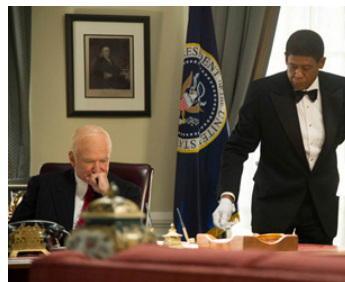
2013 LE MAJORDOME (The Butler) de Lee Daniels avec Forest Whitaker