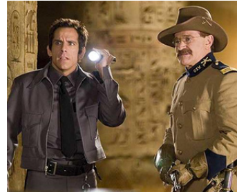
2006 LA NUIT AU MUSÉE (Night at the Museum) de Shawn Levy avec Ben Stiller