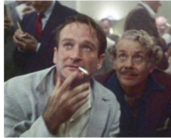
1986 LE POUVOIR DE L'ARGENT (Seize the Day) de Fiedler Cook avec Seymour Cassel