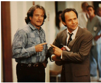
1997 LA FÊTE DES PÈRES (Father's Day) d'Ivan Reitman avec Billy Crystal