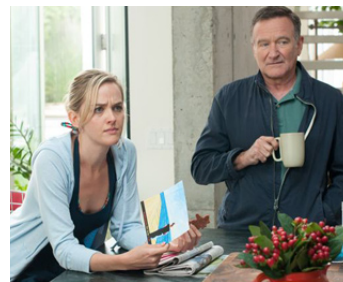
2013 THE FACE OF LOVE (The Face of Love) d'Arie Posin avec Jess Weixler