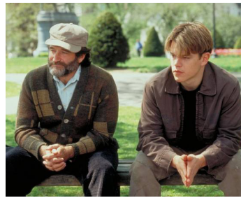
1997 WILL HUNTING (Good Will Hunting) de Gus Van Sant avec Matt Damon