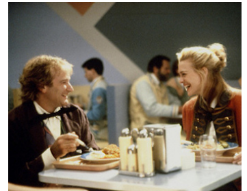
1992 TOYS (Toys) de Barry Levinson avec Robin Wright Penn