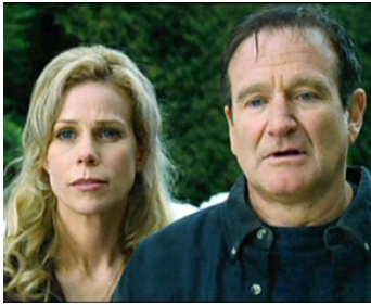
2006 CAMPING CAR (R. V.) de Barry Sonnenfeld avec Cheryl Hines