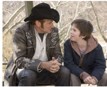
2008 AUGUST RUSH (August Rush) de Kristen Sheridan avec Freddie Highmore