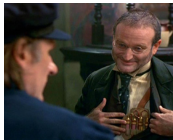
1996 L'AGENT SECRET (The Secret Agent) de Christopher Hampton avec Gérard Depardieu