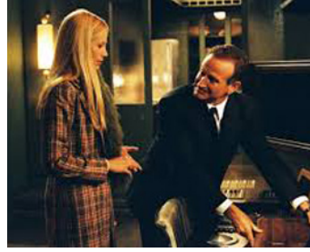
2004 FINAL CUT (Final Cut) d'Omar Naim avec Mira Sorvino