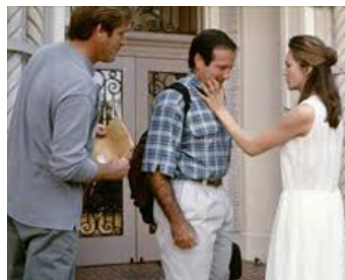
1996 JACK (Jack) de Francis Ford Coppola avec Kevin Kline, Diane Lane