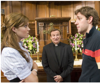
2007 PERMIS DE MARIAGE (Licence to Wed) de Ken Kwapis avec Mandy Moore, John Krasinski