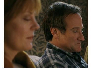
2004 NOËL (Christmas) de Chazz Palminteri avec Susan Sarandon