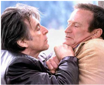
2002 INSOMNIA (insomnia) de Chris Nolan avec Al Pacino