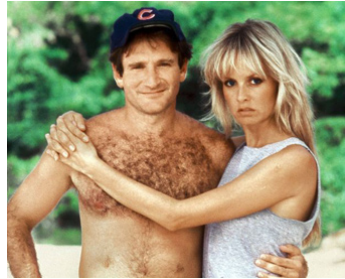
1986 CLUB PARADIS (Club Paradise) de Harold Ramis avec Twigg