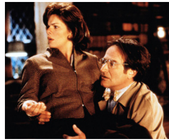
1997 FLUBBER (Plaxmol) de Les Mayfield avec Marcia Gay Harden