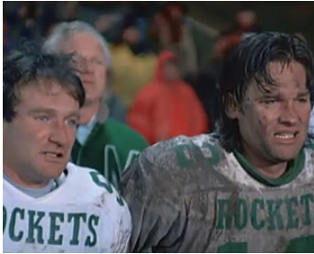
1986 LA DERNIÈRE PASSE (The Best of Times) de Roger Spottiswoode avec Kurt Russell