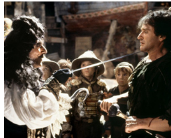
1991 HOOK (Hook) de Steven Spielberg avec Dustin Hoffman