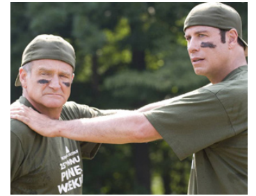
2009 LES DEUX FONT LA PÈRE (Old Dogs) de Walt Becker avec John Travolta