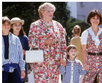
1993 MADAME DOUBTFIRE (Mrs Doubtfire) de Chris Columbus avec Sally Field