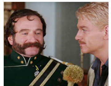
1996 HAMLET (Hamlet) de Kenneth Branagh avec Kenneth Branagh