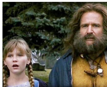
1995 JUMANJI (Jumanji) de Joe Johnston avec Kirsten Dunst