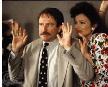
1990 CADILLAC MAN (Cadillac Man) de Roger Donaldson avec Fran Drescher