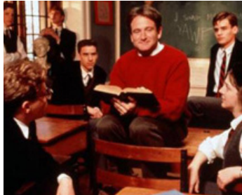
1989 LE CERCLE DES POÈTES DISPARUS (Dead Poets Society) de Peter Weir avec R. S. Leonard