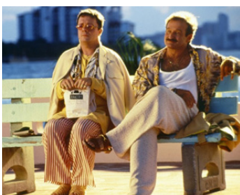
1996 BIRDCAGE (Birdcage) de Mike Nichols avec Nathan Lane