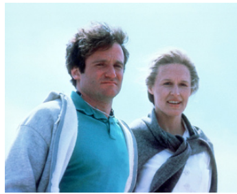
1982 LE MONDE SELON GARP (The World according to Garp) de George Roy Hill avec Glenn Close